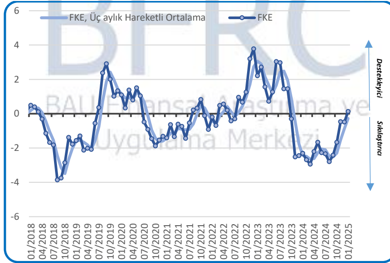
Grafik 1. Finansal Koşullar Endeksi (Standardize)